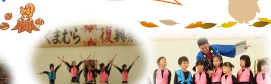
人権教室・保健の話がありました